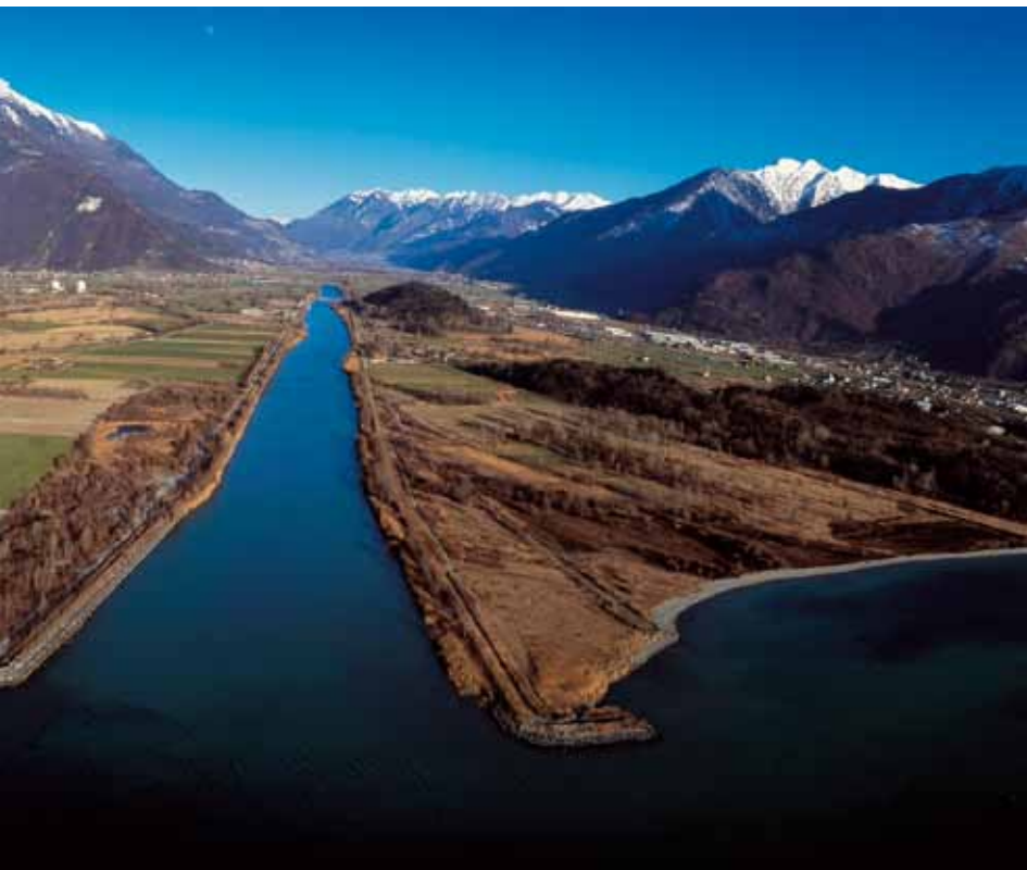
Ingresso della Valtellina da Colico e foce dell'Adda.